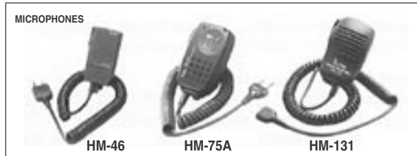
HM-46 : De petite dimension et équipé d'un jack oreillette et d'un indicateur d'émission. HM-75A : Permet de commander certaines fonctions. HM-131 : Compact solide et équipé d'un jack oreillette.