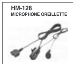
Microphone oreillette léger.