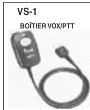
Permet une utilisation main libre. A utiliser avec le HS-94.