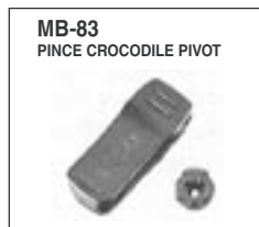
Permet de fixer de façon sécurisée le portatif à la ceinture.