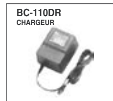
Chargeur mural simple.

Les spécifications et informations données dans ce document peuvent être modifiées sans préavis.