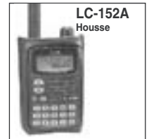
Protège le portatif