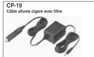
Permet d'utiliser le transceiver avec un alimentation 11 V DC sur une prise allume cigares. La batterie est chargée en même temps.