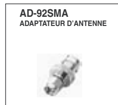
Adaptateur permettant de connecter une antenne BNC.