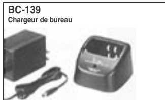
Chargeur rapide de batterie BP-217. Temps de charge approximatif : 2,5 h