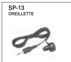
Permet d'avoir une réception claire en milieu bruyant.