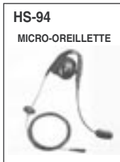
Oreillette micro à utiliser avec le boîtier VS-1.