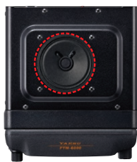
Haut-parleur de 3 Watts (66 mm)

Un haut-parleur audio de 3 W fournit un son clair et net. Le circuit a été spécialement réglé pour fournir un son de qualité. Vous pouvez profiter de communications avec un son de qualité exceptionnelle, y compris à l'extérieur et dans les environnements bruyants.